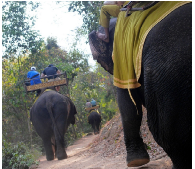
上图：在柬埔寨，装有鞍具的大象驮着游客

报告对马来西亚唯一一所识别出的大象场所中的 30 头大象进行了评估。这是我们将马来西亚纳入研究的第一年。